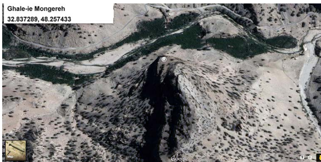
تصویر ۳. موقعیت جغرافیایی قلعه منگره برفراز قله دز (www.google.com/maps).

براساس اسناد موجود، قلعه منگره می‌تواند ادامه بسط و گسترش قدرت اسماعیلیان در دیگر کوهستان‌های ایران باشد.