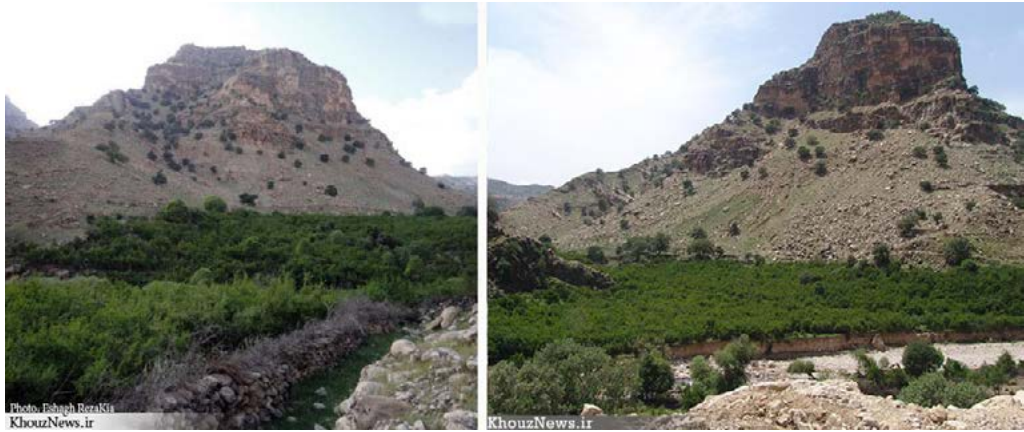
تصویر ۴. چشم‌انداز کوه دز واقع در منطقه منگره که قلعه منگره بر فراز آن واقع شده است (www.khouznews.ir).

شرقی شش مخزن برای ذخیره آب کنده شده و دیوار آن‌ها با سنگ و ملات آن با نوعی ساروج ساخته شده است (تصویر ۵).