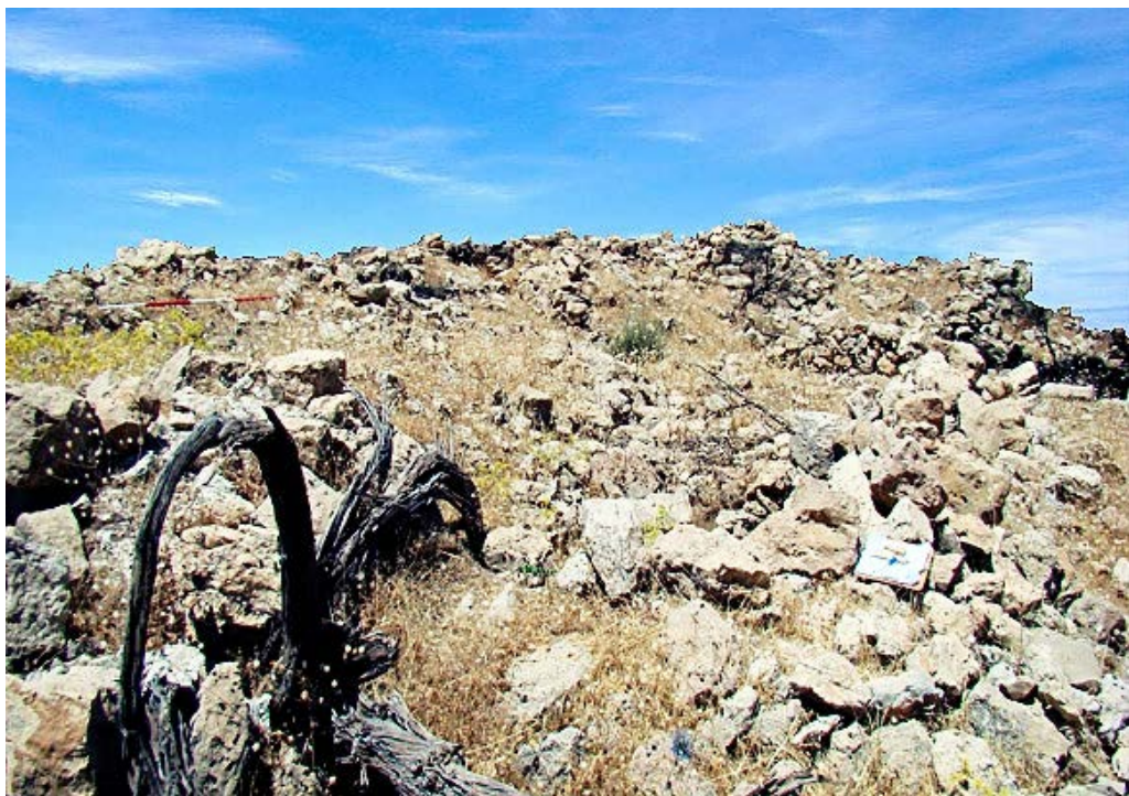
تصویر ۵. ویرانه‌های قلعه منگره (گزارش انجمن میراث فرهنگی اندیمشک).

دیدگاه قلعه طوری است که دشت شرقی که اینک با ایجاد سد دز آن را آب فرا گرفته به خوبی نمایان است. در کنار قلعه دز دره منگره قرار دارد و در نقطه‌ای به نام گرداب حجم زیادی از آب از عمق زمین خارج می‌شود و به دره می‌ریزد. آنچه که در آنجا به چشم می‌آید وجود آسیاب و مقابر است. بر اساس معماری و مصالح به کار رفته در آسیاب‌ها، قدمت آن‌ها به دوره ایلیخانان می‌رسد. آنچه مسلم است قلعه منگره که از نظر نظامی اهمیت ویژه‌ای داشته و همواره در آن برهه از تاریخ بر سر آن کشمکش و درگیری رخ داده، در یکی از مهم‌ترین دوران حیات خود در دست اسماعیلیان بوده است. نگارندگان معتقدند زمانی که پایان عمر اسماعیلیان به دست ایلیخانان رقم