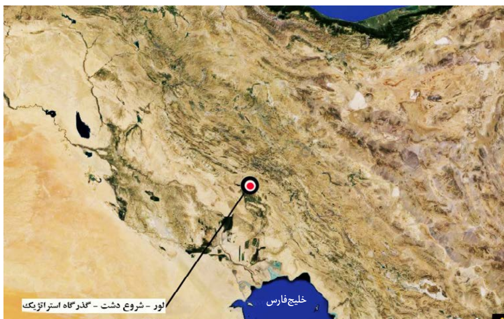
تصویر ۱. دشت لور.

قرار دارد. این جاده از عصر باستان نیز وجود داشته و آشوربونی پال در لوحه خود آورده است که: سربازان من در محلی که رودخانه کرخه وارد دشت می شد، از این رود عبور کردند (رو، ۱۳۸۱: ۳۶۹) و تمدن ایلام باستان را نابود کردند. این سند نشان می دهد که از دیرباز گذرگاه فوق وجود داشته است.